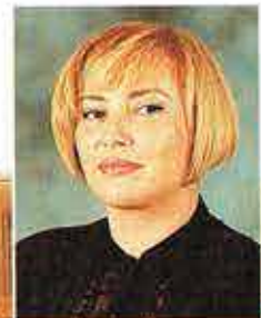
מאת: קול שושנה, אדריכלית

כתבה פותחת בסדרת כתבות: חורה נבוכים לרוכש מטבח